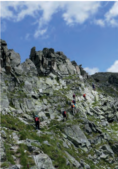
Subiendo al Musala Peak

dos agolpados como la harina que amasa el pan: a unos les seguirán crujiendo las posaderas y los costillares, consecuencia del ladinio somier del hotel; a otros les escocerán todavía los ojos de ver una día tras otro la cama sin hacer; a más de cuatro le berrearán aún las uñas, las rodillas y los tobillos tras la ascensión fragosa y sumamente empedrada a las cumbres del Musala Peak, el Malyovitsa o el Cherni Vrah techos balcánicos por excelencia; y qué decir de los innumerables y bellísimos lagos que ahondados embellecen las praderías, pese a las incontables y rocosas tormentas; y ¡ay! de los que padecemos en nuestras testas, traseros y