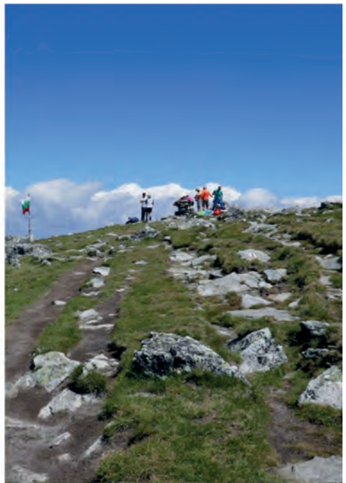
En el Malyovitsa